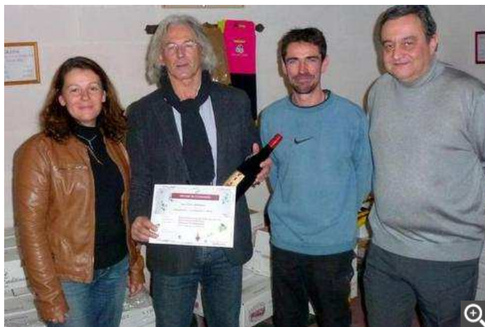
Les covignerons du Domaine de Rabelais 2013, place au millésime 2014!